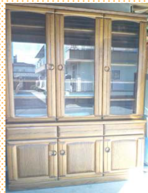
食器棚 ¥1320×D460×H2000 *無垢で重厚な造りです。