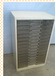
コクヨ製 書類整理庫 15段 ¥540×D360×H880 *A3サイズまで収納できます。