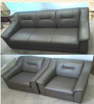
本皮ソファセット 3人掛けソファ ¥1800 1人掛けソファ ¥870×2