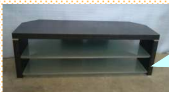
TVボード ¥1400×D450×H450 *ダークウッド・中棚はガラス!