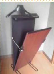
英国 RussellHobbs スポンブレッサー 定格電圧: 100V 50/60HZ 消費電力: 200W *2~3回しかご使用になっていないそうです。