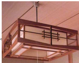
*木製照明：A 1個 引掛けシーリング

大好評！ガレーセール！ 取りに来て頂ける方に 無料で差し上げます！！ 応募多数の場合は 抽選をさせていただきます。 5月15日の正午まで エントリー受付！！ お気軽にお電話下さい。