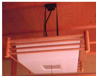
*木製照明：B 2台セット 引掛けシーリング