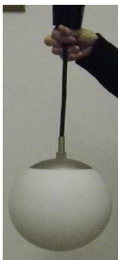
*ペンダントライト