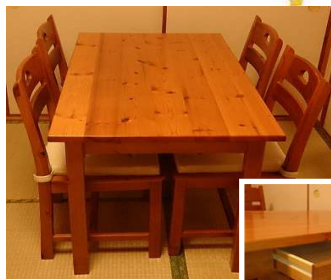
便利な引き出し付き 食卓セット (4脚) W1200*D700 *H732

★希望者が複数の場合、DM 発送後約10日を目安に抽選しております。フリーダイヤルでお気軽にエントリーして下さい♪