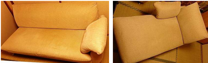
ソファ+カウチセット (布製) 左: W1340 右: W1550

いつも沢山のご応募ありがとうございます！！ ご好評いただいているガレージセール スペシャル！ リフォーム工事に伴い、まだ使える物が不要になってしまう事があります。取りに来て下さる方に無料でお譲りします。奮ってご応募ください！