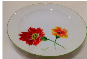
*大皿 約24cm KENZO