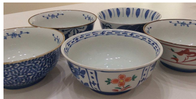
*大鉢 約cm どんぶりサイズ。5個セット

いつも多数のご応募ありがとうございます！ 10月15日の正午までエントリー受付！！