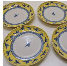
*中皿 約19cm 橘吉