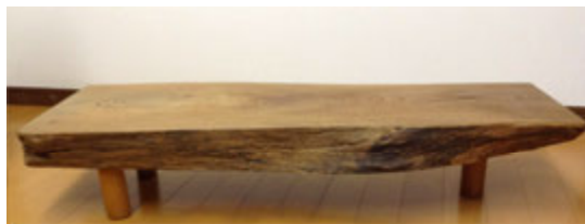
横幅約94cm 重く立派です。

取りに来てくれる方に、無料でお譲りしています。 抽選となります 4月20日の正午まで受付！！ ご興味のある品がありましたら、お気軽にエントリーのお電話ください！