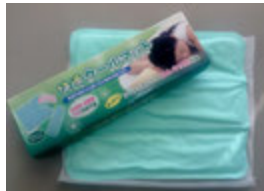
*枕に敷くだけで涼しい！ 快適クールマット 未使用