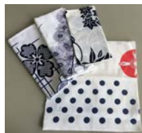
*手ぬぐい 未使用品です。