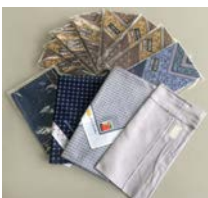
*男性用ハンカチ 未使用品です。