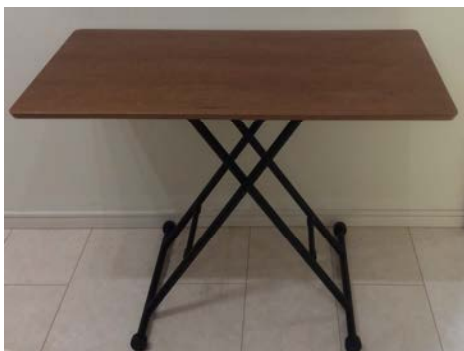
*テーブル (ウォールナット色にブラックの脚) 横 110cm×奥行 55cm 高さは調整可能です。