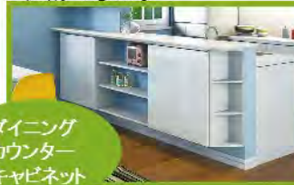
ダイニングカウンターキャビネット

畳スペースの下に収納を配置。座ったり、寝転んだり、くつろぎの場としても使えます。