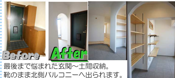
最後まで悩まれた玄関→土間収納。靴のまま北側バルコニーへ出られます。