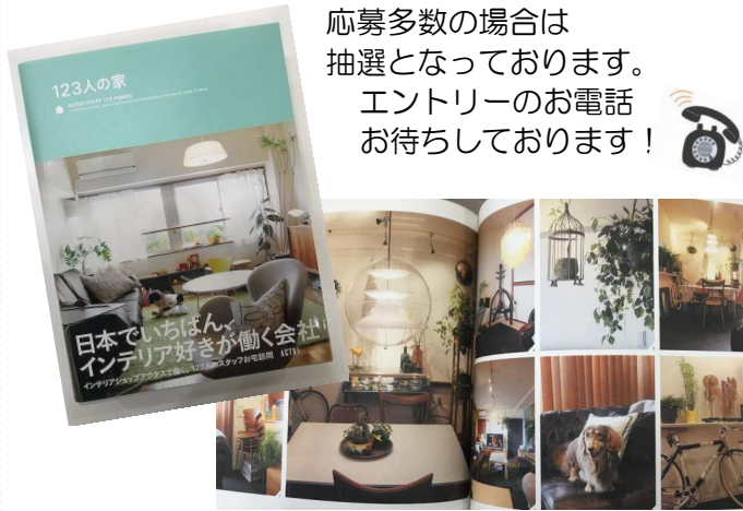
*インテリア写真集 【123人の家】 締め切りは6月27日正午まで

応募多数の場合は 抽選となっております。 エントリーのお電話 お待ちしております！