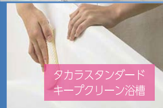
タカラスタンダード キープクリーン浴槽