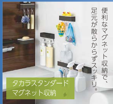
タカラスタンダード マグネット収納