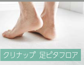
クリナップ 足ピタフロア