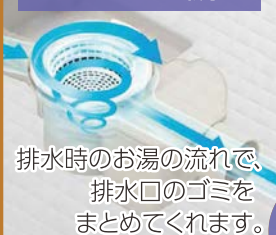
LIXIL くるりんポイ排水口