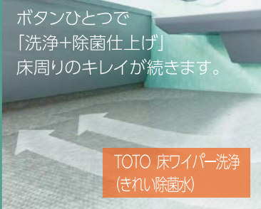
TOTO 床ワイパー洗浄 (きれい除菌水)