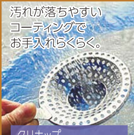
クリナップ クリーンヘアキャッチャー