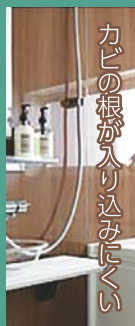
クリナップ クリンパッキン