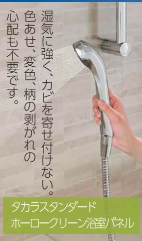
タカラスタンダード ホーロークリーン浴室パネル