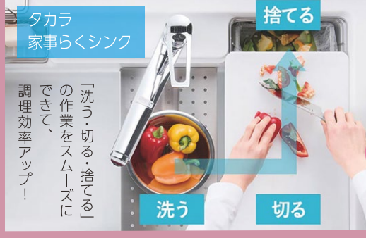
タカラ 家事らくシンク