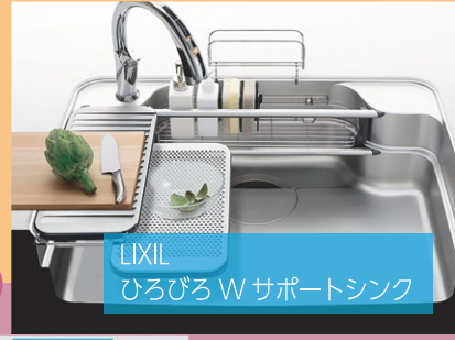
LIXIL ひろびろ W サポートシンク

せっかくリフォームするなら最新のステキな機器を選びたい！ そんなあなたにぴったりの最新設備をシリーズでご紹介します。