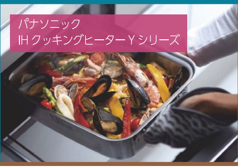
パナソニック IH クッキングヒーターYシリーズ