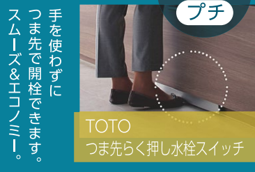
TOTO つま先らく押し水栓スイッチ