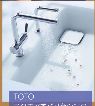
TOTO スクエアすべり台シンク