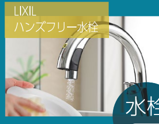
LIXIL ハンズフリー水栓