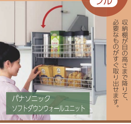
パナソニック ソフトダウンウォールユニット