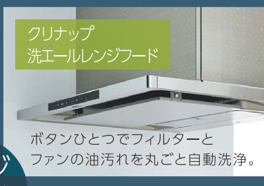
クリナップ 洗エールレンジフード