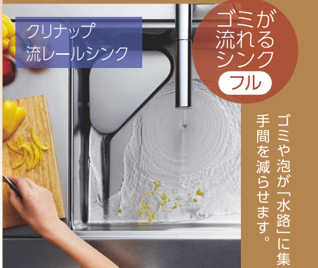
クリナップ 流レールシンク