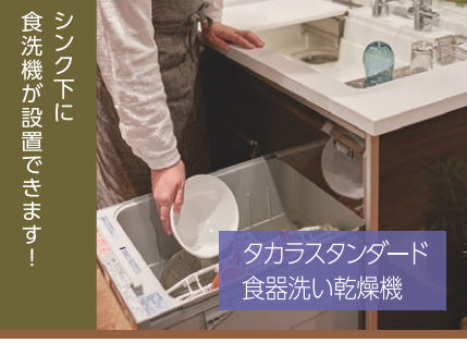
タカラスタンダード 食器洗い乾燥機