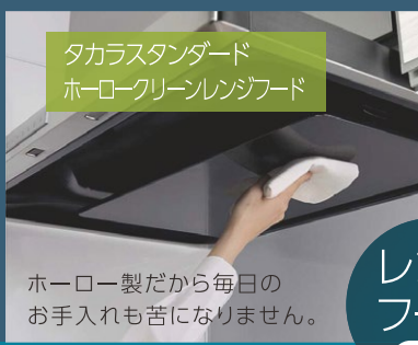
タカラスタンダード ホーローグリーンレンジフード