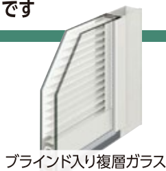
ブラインド入り複層ガラス